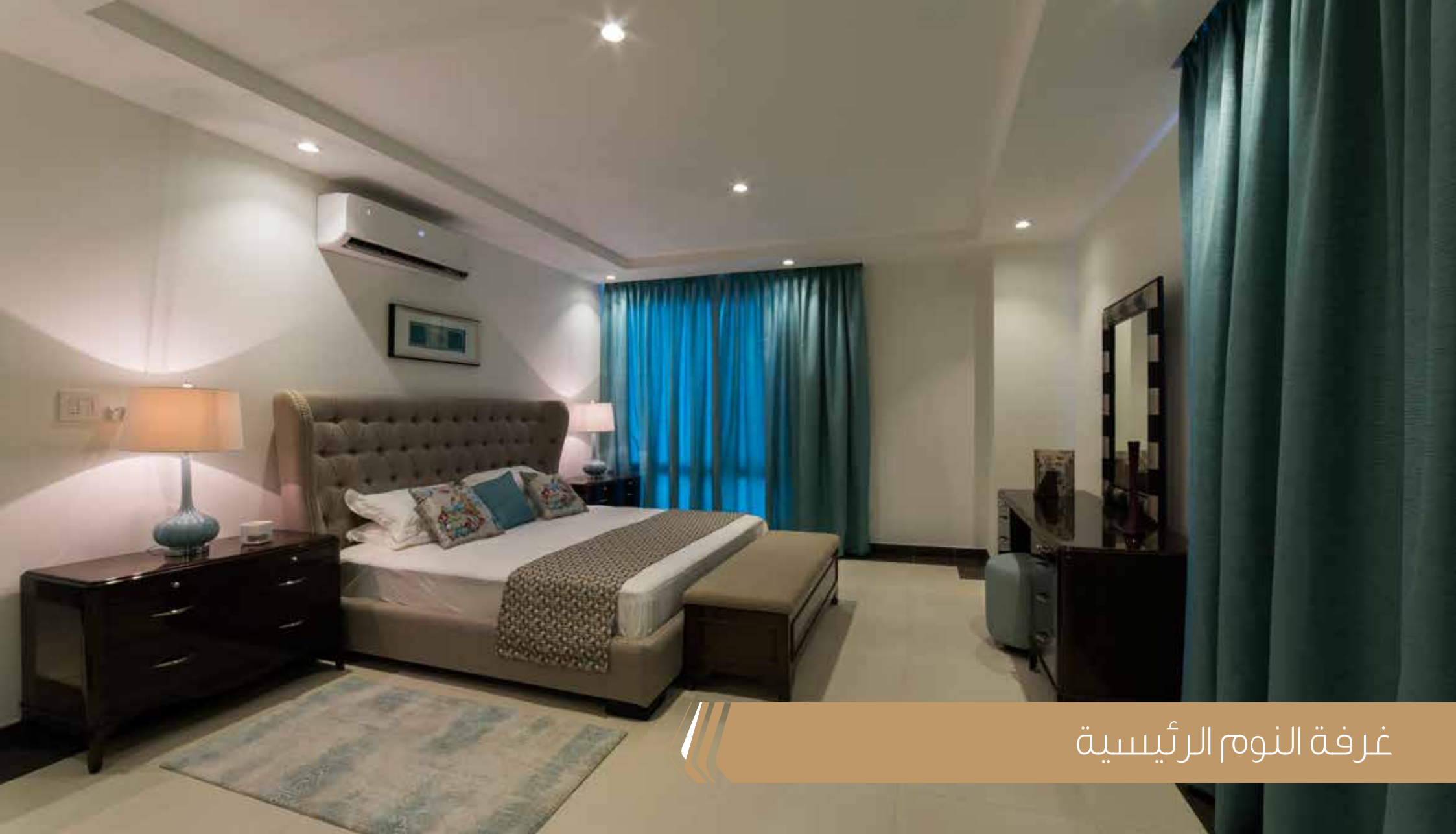
غرفة النوم الرئيسية